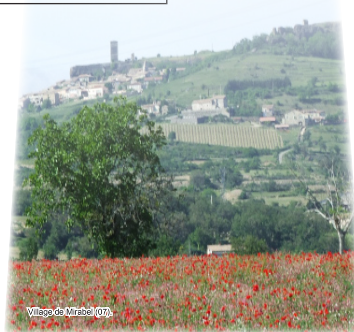
Village de Mirabel (07).